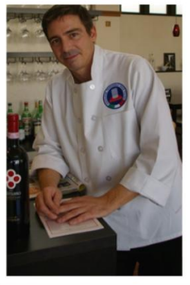
ヴォラーレ ピエトロシエフ